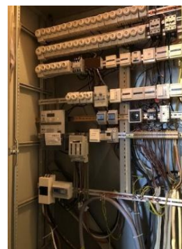
Sikringsskapet i Arnadal kirke

Gamle elektriske anlegg medfører både en risiko og begrenser mulighetene til å gjøre nødvendige forbedringer for energibruken. Bildet under er fra Arnadal kirke. Når kirken er i bruk, må man inn i selve sikringsskapet for å skru på lys o.l. I utgangspunktet er det kun autorisert personell som har lov til å åpne dette sikringsskapet, men som i praksis ikke er gjennomførbart. Sandefjord kommune har bevilget midler til nytt elektrisk anlegg i Arnadal og Sandar kirker, henholdsvis i 2026 og 2027. Når dette er utbedret gjenstår kun det elektriske anlegget Stokke kirke.