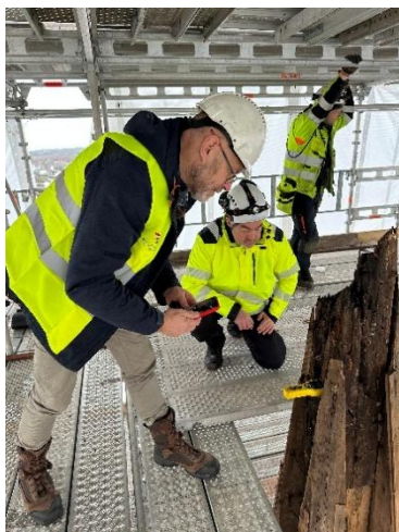
Sandefjord kirke, nytt tak

Taket på Sandefjord kirke har hatt et stort behov for vedlikehold. I 2024 bevilget Sandefjord kommune kr 20 millioner til utbedring av taket på Sandefjord kirke. I begynnelsen av 2025 ble det bevilget kr 13,75 millioner fra Kirkebevaringsfondet til dette prosjektet. Disse tilskuddene medførte at utbedringen ble igangsatt sommeren 2025, og vil stå ferdig innen sommeren 2026. Dette er et løft for hele Sandefjords bybilde.