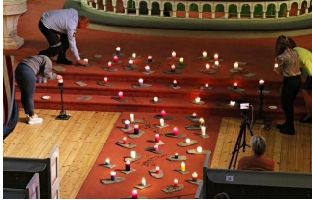
Fra markeringen «Du er ikke alene» - Sandefjord kirke