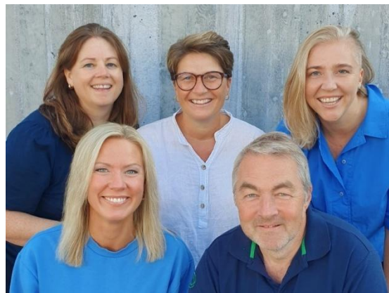
Våre medarbeidere i 13-20

Tilbudet 13–20 har mottatt tilskudd siden 2023. I 2025 utgjorde tilskuddet kr 527 000 fra Sandefjord kommune og kr 201 000 fra Tunsberg bispedømme. Midlene har bidratt til å videreutvikle og styrke det diakonale tilbudet til målgruppen. Det kan ved første øyekast fremstå som om tilbudet er bemannet med fem ansatte, men fra og med høsten 2026, er den dedikerte bemanningen til 13–20 samlet sett 0,7 årsverk, fordelt på to ansatte. I tillegg bidrar tre øvrige ansatte inn i arbeidet med avgrensede og tidsavhengige oppgaver som en del av sine ordinære stillinger. Dette gir et samlet og tverrfaglig bidrag til tilbudet, uten at disse ressursene er fullt ut avsatt til 13–20.