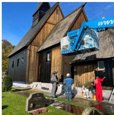
Tjæring Høyjord stavkirke

Høsten 2024 ble deler av Høyjord stavkirke tjæret som ledd i det løpende vedlikeholdet av kirken, og dette arbeidet skal ferdigstilles våren 2026. Tiltaket er et viktig ledd i bevaringen av stavkirken, ettersom tjæring beskytter treverket mot fukt, råte og slitasje. Kostnadene ved arbeidet dekkes av Riksantikvaren og Sandefjord kommune. For å oppnå et varig og godt vern er det nødvendig med jevnlig tjæring også i årene fremover, der ulike deler av kirken behandles etter tur. Erfaring tilsier at ett strøk tjære gir beskyttelse i om lag ett år, mens to strøk kan gi en virkningstid på opptil tre år, noe som understreker behovet for en langsiktig og planmessig vedlikeholdsstrategi.