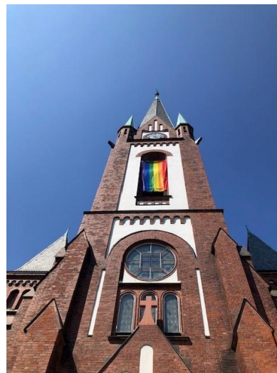
Regnbuemesse blir hvert år feiret i Sandefjord kirke.

Gjennom gudstjenester, diakoni, kulturarbeid og samarbeid med frivillige og kommunen ønsker kirken å bidra til fellesskap, likeverd og tilhørighet. Det legges vekt på å møte mennesker med respekt og å skape rom for deltakelse og medvirkning, både blant ansatte, frivillige og brukere av kirkens tilbud.