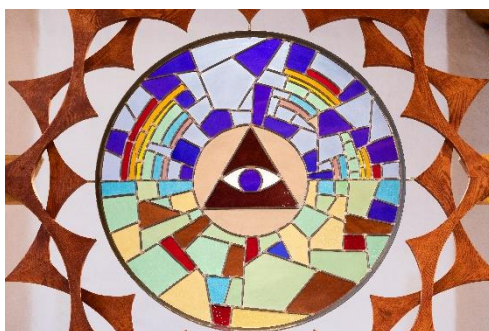
Altersmykke – Bugården kirke

Sandefjord kirkelig fellesråd har et overordnet ansvar for å forvalte, ivareta og videreføre den kirkelige kulturarven lokalt, både som levende gudshus og som sentrale kulturhistoriske bygg. Ansvaret omfatter drift, vedlikehold og vern av kirkebyggene, inkludert faste konstruksjoner og interiør, samt forsvarlig håndtering av inventar og kirkekunst. Fellesrådet skal sikre at kulturhistoriske verdier tas vare på i tråd med antikvariske hensyn og gjeldende regelverk, samtidig som kirkene brukes aktivt til kirkelige formål. I dette ligger også et ansvar for formidling og tilgjengeliggjøring av kulturarven for lokalsamfunnet, skoler og allmennheten, i samarbeid med kommunen, menighetene, kulturmyndigheter og andre relevante aktører.