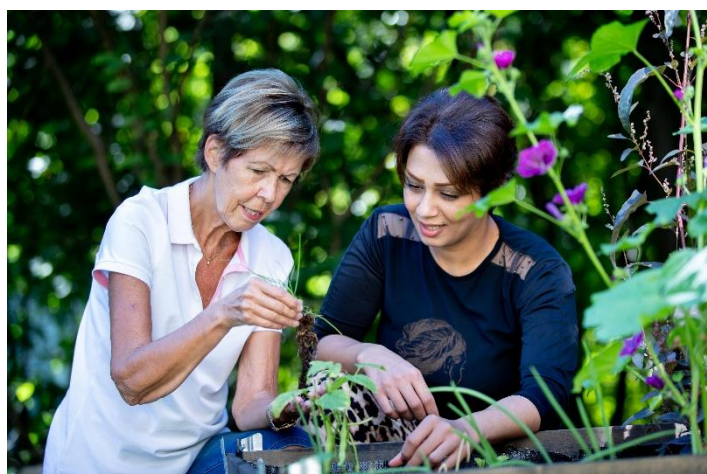
Fellesskap rundt troen

Frivillig arbeid er viktig og betydningsfullt for både de som får glede av innsatsen og for de som utfører det. Gjennom et bredt spekter av aktiviteter opplever mange av kommunens innbyggere tilhørighet og fellesskap i Den norske kirke.